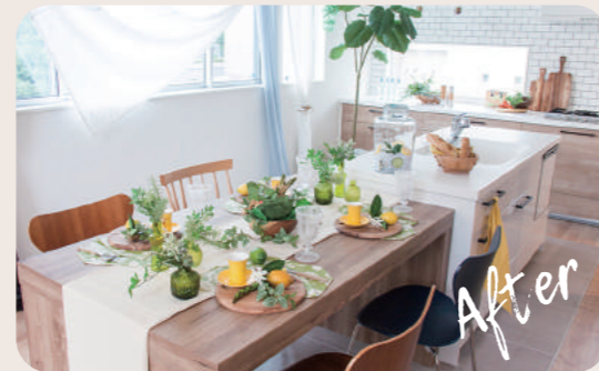
VMD視点のディスプレイを実施した空間