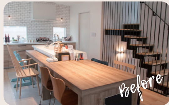
演出されていない空間