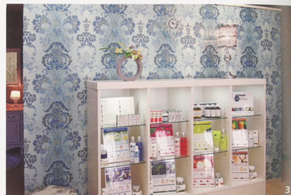
1 応接室の窓高の低い5連窓には天井近くからカーテンを吊し、空間を広く見せている。ストレートバランスにスワッグを重ねてクオリティの高さを表現。ダマスク模様のシアーカーテンがドレスのような高級感を生む。間のリボンは貴婦人たちが手をつないでいるイメージ。2 エステルームのカーテンは、アムステルダム街並みをプリントした印象的なシアー。後幕のドレパリーをパープルにして映り込みを柔らかくした。3 間仕切り壁にはデザイナーズギルドの壁紙を貼り高級感を演出。