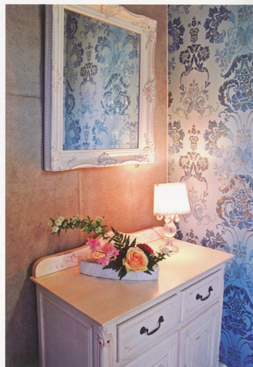
北側のエントランスは暗くなりがちなので、スタンド照明を配して雰囲気盛り上げた。ダマスク柄の壁紙が非日常空間へ誘う。