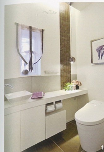
1 花の額絵と同調するシェードの曲線が、硬質なパウダールームの印象を和らげる。2 ドレッシングルームは縦ストライプ柄のシアーをバルーンシェードに仕立ててフェミニンに。生地の曲線と円形ミラー、バラ柄の壁紙が柔らかみを、タイルの長方形がスマートさを演出する。