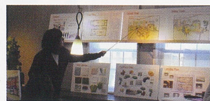
2017年3月、卒業課題のプレゼンテーション。インテリアの知識がまるでなかった生徒もここまでくればプロへの自覚が芽生えるまでに。それぞれの個性溢れる提案に成長を感じます。