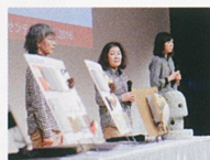
2016年12月、東京・サントリーホールでの公開プレゼンテーションに参加。