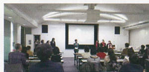
「バルティ」で開催された栃木県内企業へのプレゼンテーションでの一コマ。クラス全員が2チームに分かれて、それぞれの提案をプレゼンし、就職活動につなげます。